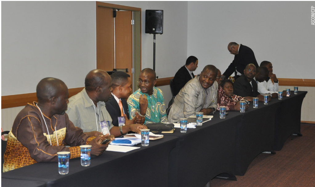
Seminário teve participação de psicólogas(os) do Brasil, Angola, Cabo Verde, Moçambique e Portugal.

O intercâmbio entre as práticas dos (as) profissionais de Psicologia de países que integram a Comunidade de Países de Língua Portuguesa (CPLP), foi um dos principais temas discutidos durante o II Seminário da Psicologia nos Países de Língua Portuguesa. Estabelecer linha conjunta de atuação e colaboração para aprimorar os níveis científicos, de pesquisa, docência, culturais e sociais da profissão de psicólogo (a) dos países envolvidos foi o objetivo principal do encontro.